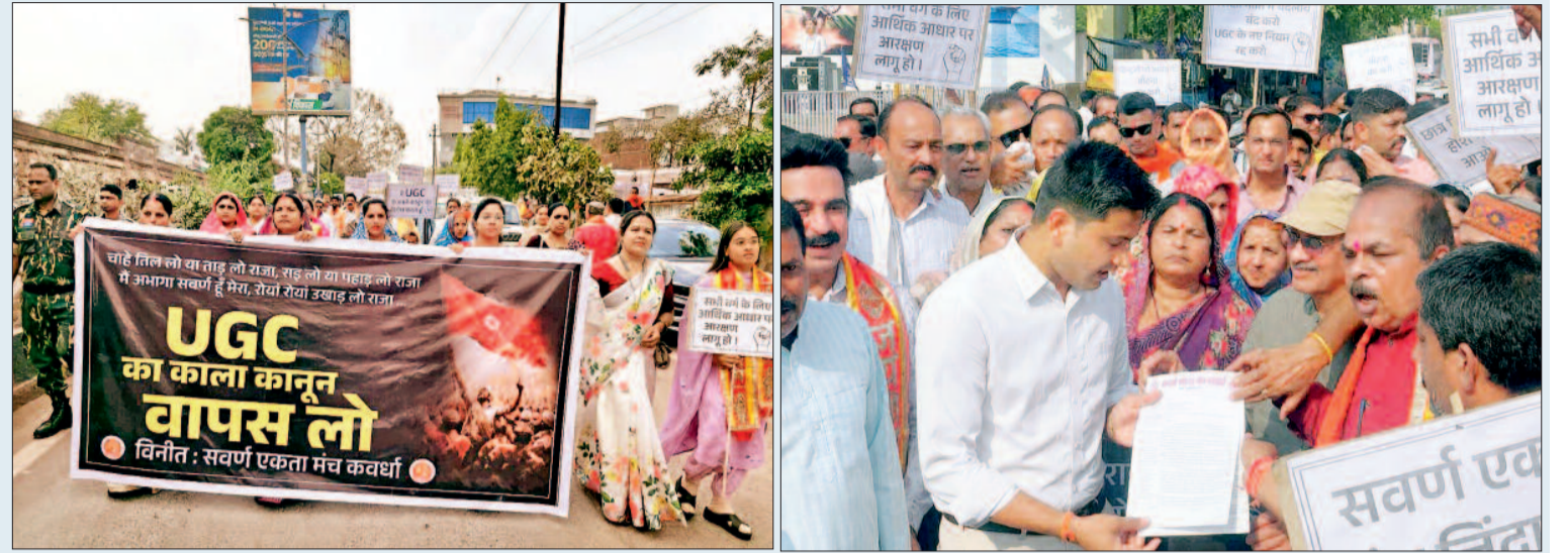
गांधी मैदान से निकाली गई विशाल रैली

इस अधिसूचना में अनुसूचित जाति, अनुसूचित जनजाति, अन्य पिछड़ा वर्ग तथा दिव्यांग छात्रों के अधिकारों की सुरक्षा के लिए प्रावधान किए गए हैं तथा संस्थानों में इक्विटी कर्मेटरियों के गठन की बात कही गई है। महापंचायत में शामिल वक्ताओं का कहना था कि इस अधिसूचना में सामान्य वर्ग के छात्रों की सुरक्षा और इक्विटी कर्मेटरियों में उनके प्रतिनिधित्व को पूरी तरह नजरअंदाज किया गया है, जो गंभीर संवैधानिक प्रश्न खड़े करता है। उन्होंने आरोप लगाया कि अधिसूचना में दुर्भावनापूर्ण अथवा झूठी शिकायतों पर किसी प्रकार के दंड का प्रावधान नहीं है, जिससे इसके दुरुपयोग की आशंका बढ़ जाती है। सवर्ण समाज के लोगों में यूजीसी रेगुलेशन 2026 को लेकर खासा असंतोष व आक्रोश देखने को मिला।