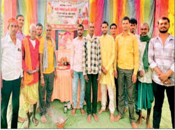
की दिशा में कार्य किया। उन्होंने कहा कि समाज के लोगों को आत्मसम्मान